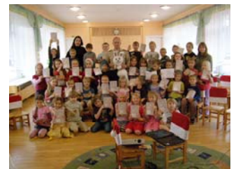
Jõuluõhtu tuleb, süütab